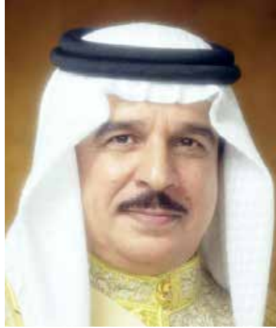
صاحب الجلالة الملك حمد بن عيسى آل خليفة ملك مملكة البحرين المعظم