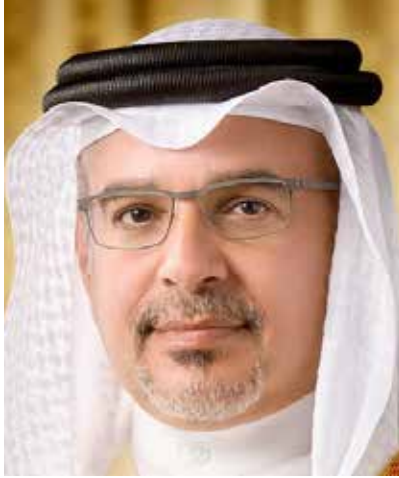
صاحب السمو الملكي الأمير سلمان بن حمد آل خليفة ولي العهد نائب القائد الأعلى للقوات المسلحة رئيس مجلس الوزراء الموقر